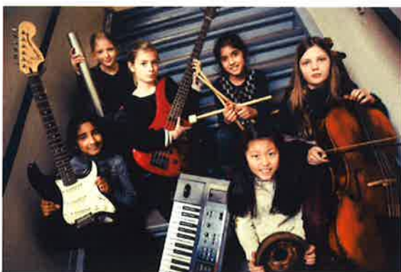
JazzCamp for Piger.

Det er JazzDanmarks vurdering, at målsætningen for dette område er opfyldt og mere til.