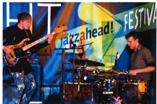
Danske bands på I Love Danish – den danske clubnight på Jazzahead 2017.