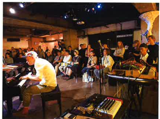
Opposite 2017.