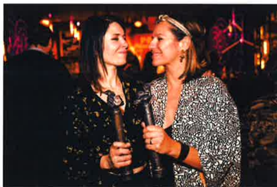
DMA Jazz 2017.

Samarbejdet med etablerede medier står også fortsat højt på JazzDanmarks dagsorden, og i 2017 fortsatte vi det frugtbare samarbejde med TV2/Lorry som endnu engang transmitterede årets Danish Music Awards Jazz show på de fleste af de regionale TV2-kanaler. Samarbejdet med DR P8